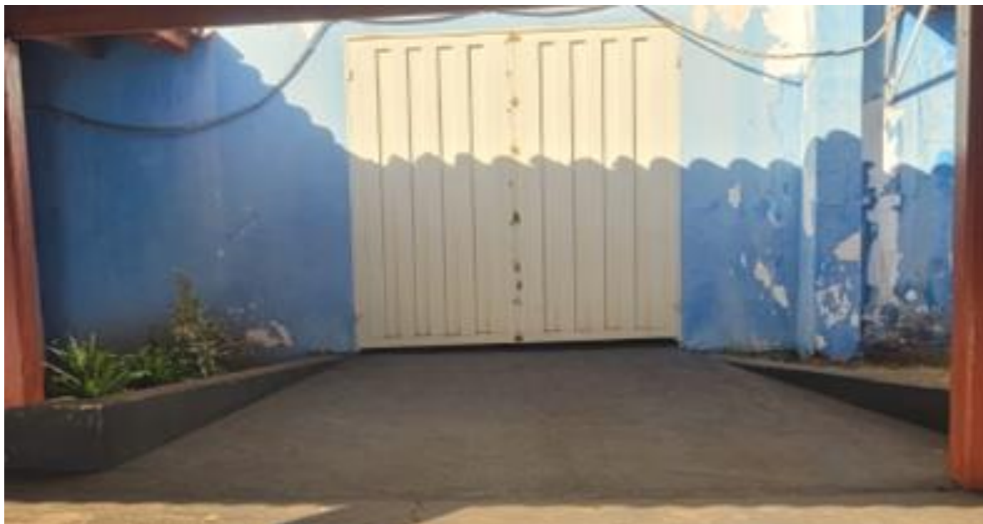
Entrada do Salão de Eventos Ipuã Country Clube

O Local da apresentação já possui rampa de acesso para cadeirantes, na platéia serão disponibilizado lugares sinalizados para cadeirantes e pessoas com necessidades especiais.